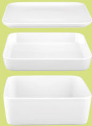
Servierplatte / Deckel eckig 5300 24 x 24 cm Platter / lid square 9.4 x 9.4 inch