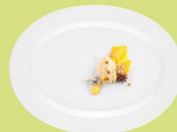
Servierplatte oval 35 x 26 / 31 x 23 cm Platter oval 13.8 x 10.2 / 12.2 x 9.1 inch