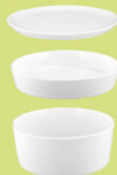
Servierplatte / Deckel rund 5298 21 cm Platter / lid round 8.3 inch