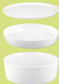
Servierplatte / Deckel rund 5299 25 cm Platter / lid round 9.8 inch