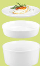
Servierplatte / Deckel rund 5297 19 cm Platter / lid round 7.5 inch