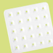
Abtropfeinsatz M5337 20 x 20 cm Draining insert M5337 7.9 x 7.9 inch