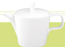
Kanne 1,20 ltr. Coffee / Tea pot 40.0 oz.