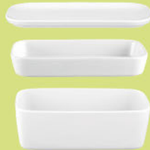
Servierplatte / Deckel eckig 5301 24 x 12 cm Platter / lid rectangular 9.4 x 4.7 inch