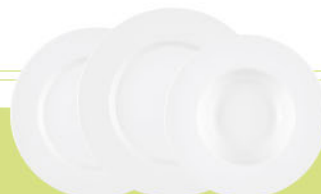
Frühstücks- / Brotteller rund 24 / 20 cm Speise- / Suppenteller rund 28 / 23,5 cm Plate flat round / Soup plate round 9.4 / 7.9 inch 11.0 / 9.3 inch