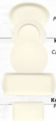
Servierplatte oval 34 x 26 / 31 x 21 27 x 18 / 23,5 x 14 cm Platter oval 13.4 x 10.2 / 12.2 x 8.3 10.6 x 7.1 / 9.3 x 5.5 inch