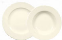
Frühstücks- / Brotteller rund 20 / 17 cm Plate flat round 7.9 / 6.7 inch