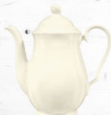
Kaffeekanne 1,30 ltr. Coffee pot 43.3 oz.