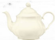
Teekanne 1,10 ltr. Tea pot 36.7 oz.